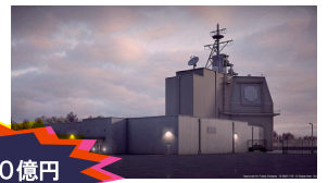
秋田山口県に配備予定