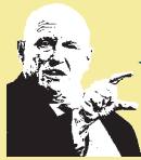
アーミテージ元国務副長官