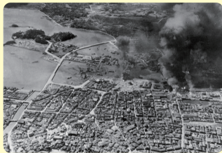
10・10空襲時の那覇港および旧那覇市街 1944年10月10日